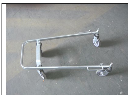
Hjul monteres på bundramme