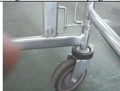
Og fastspænd med møtrikkerne indvendigt