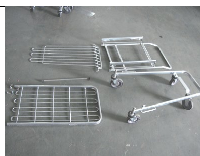
Læg alle dele løst ud på gulvet