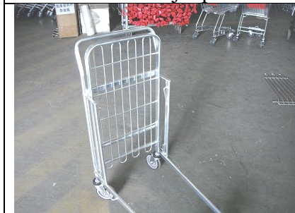
Skub øverste hylde løst ned