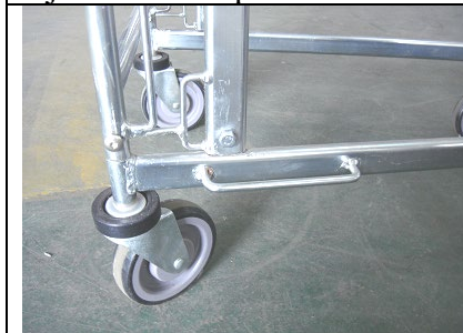
Monter skubbebøjle på bundramme