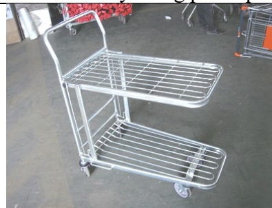
Nu skulle din nye butiksvogn være klar